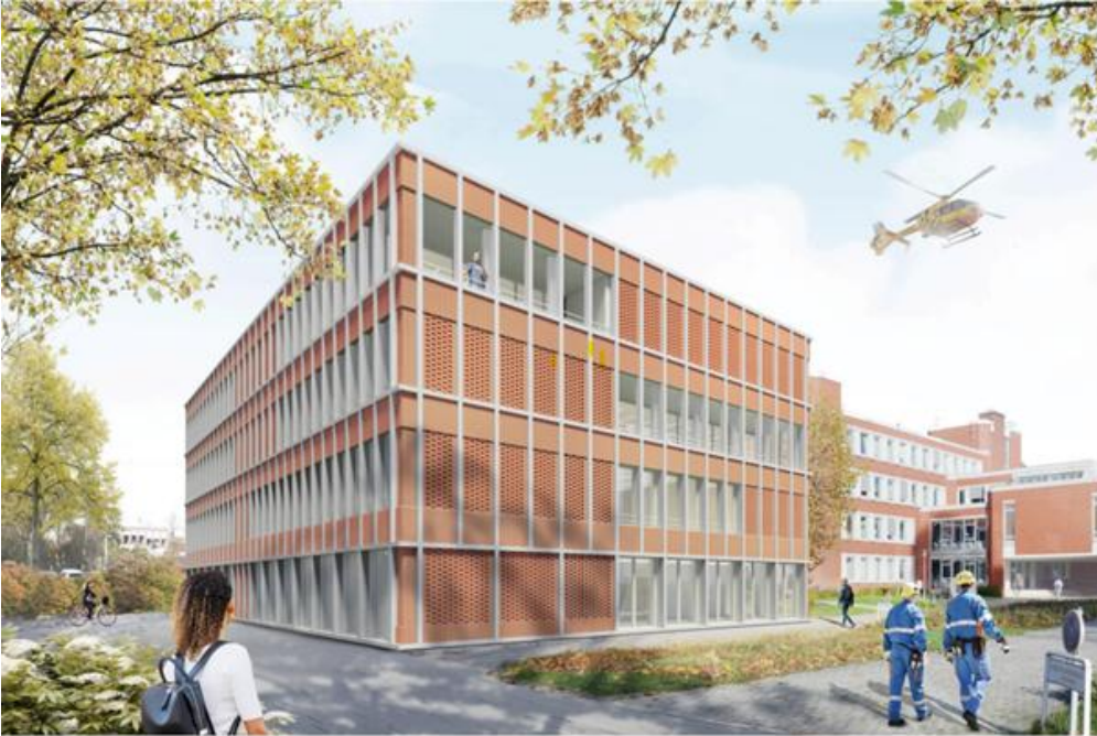
AV1 Architekten GmbH